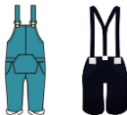
オーバーオール、 サロペット、 サスペンダーなど 肩ひもがある服