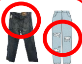
ループつき、 穴あきのパンツ